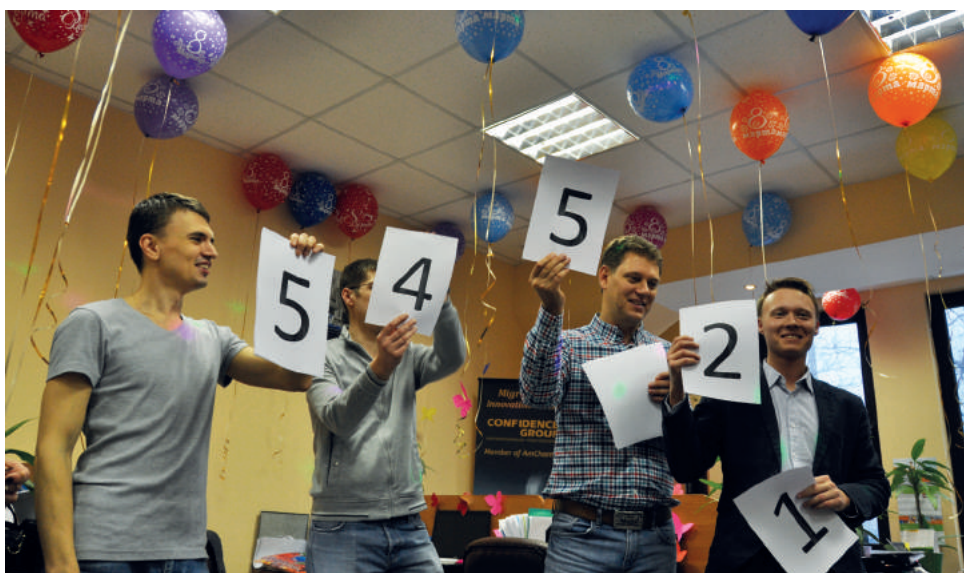
Празднование 8 Марта в офисе компании

В преддверии весеннего праздника 8 Марта, Компания Конфиденс Групп поздравила женщин компании. Праздничное мероприятия для прекрасной половины нашего коллектива включало поздравления, подарки, конкурсы. Как всегда, праздник удался, оставив в памяти прекрасные воспоминания и яркие фотографии.