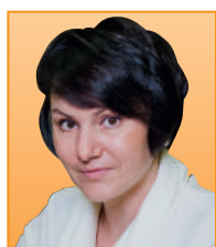
Статью подготовила Комиссарова Мария, консультант компании Конфиденс Групп

Иностранное юридическое лицо, деятельность которого носит коммерческий характер, имеет право осуществлять