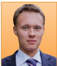
Статью подготовил Воробьев Алексей , юрист компании Конфиденс Групп

На рассмотрение Государственной Думы Федерального Собрания РФ был внесен подготовленный Правительством РФ проект федерального закона, предусматривающий повышение ответственности работодателей за задержку выплаты заработной платы работникам и ряд других противоправных деяний в сфере трудовых отношений.