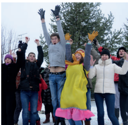
Корпоративное мероприятие «Падал прошлогодний снег»

Видеосъемка мероприятия легла основу 10-ти минутного ролика о рабочих процессах и досуге сотрудников компании Конфиденс Групп, доступного на страничке https://www.facebook.com/CONFIDENCE-GROUP .